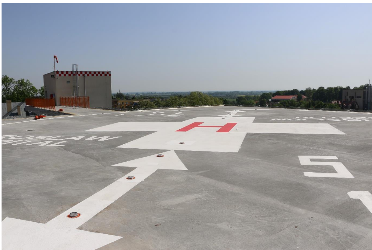
Lądowisko – COM Jarosław