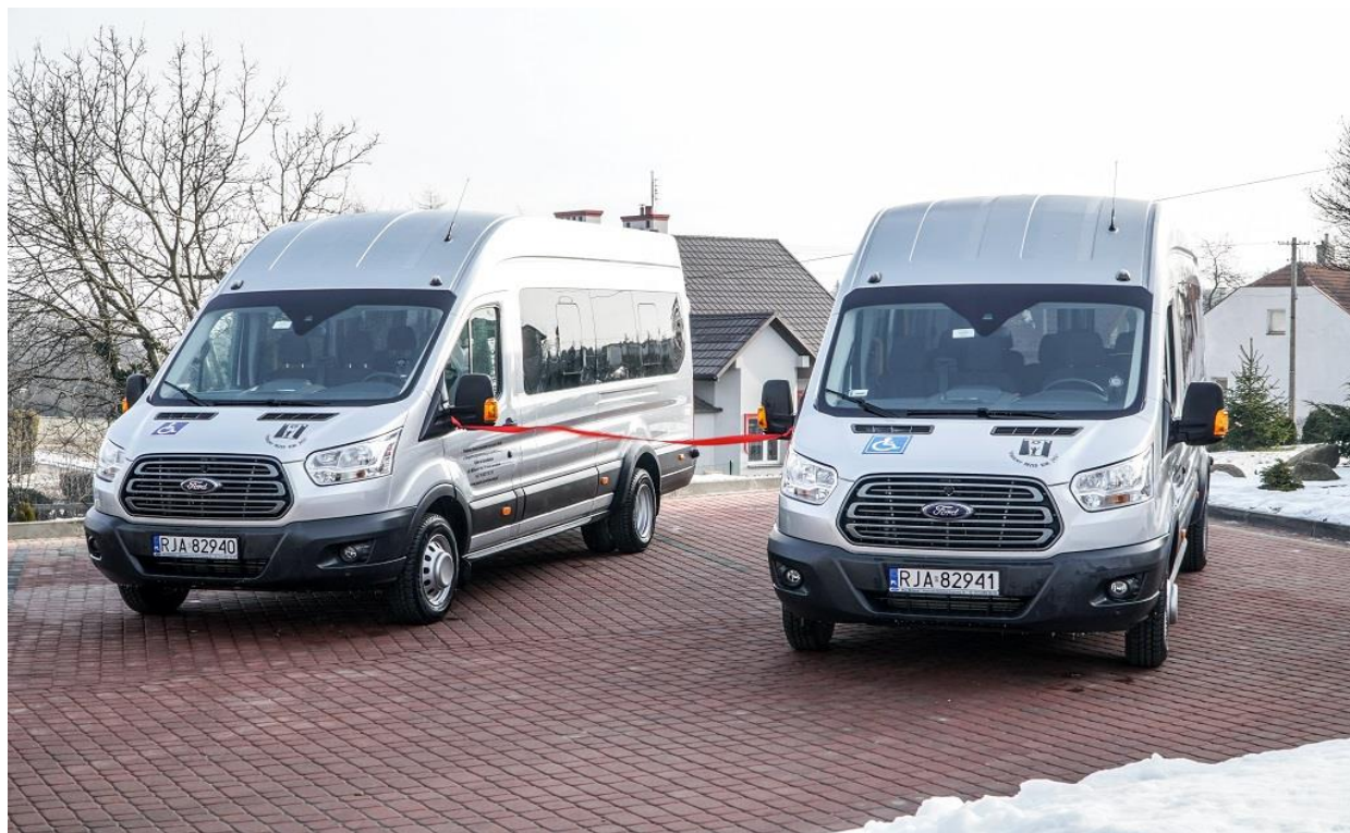
W 2018 r. Powiat Jarosławski podpisał m.in. umowę na zakup nowego autobusu przeznaczonego do dowozu osób z niepełnosprawnościami.

Powiatowe Centrum Pomocy Rodzinie realizowało również w roku 2018 programy i projekty dotyczące wspierania rodzinnej pieczy zastępczej: asystent rodziny i koordynator rodzinnej pieczy zastępczej, Rodzina 500 Plus oraz rządowy program "Dobry start".