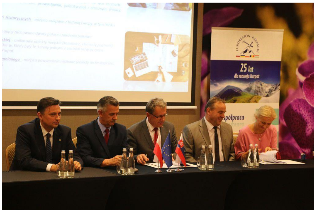
Podpisanie umowy na realizację projektu „Twoje miejsca – Twoje dziedzictwo”.