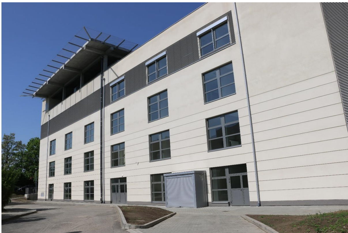
Budynek COM Jarosław