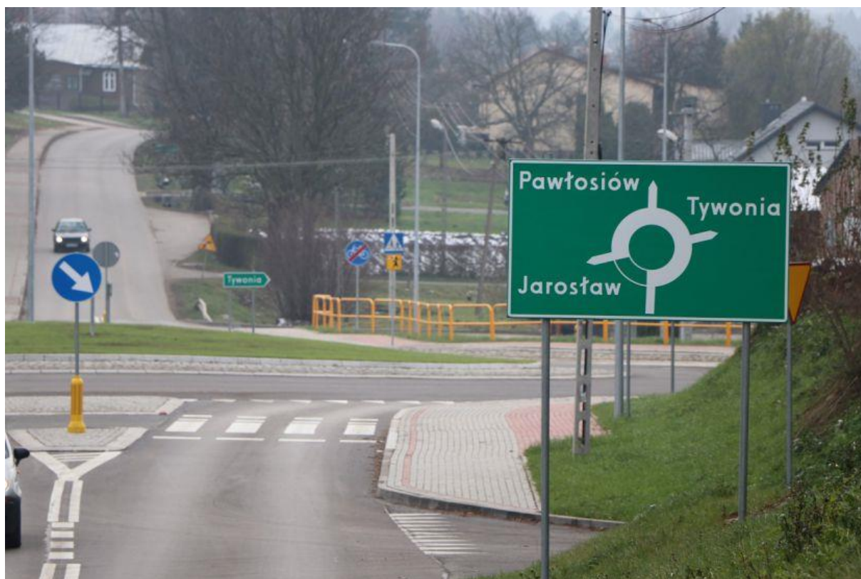
Realizacja inwestycji łączącej Jarosław z autostradą A4, nowe rondo na ul. Pawłosiowskiej.