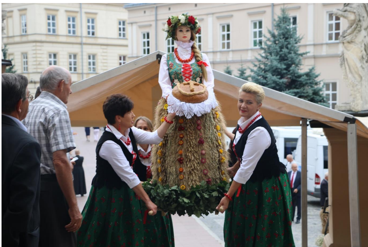
Dożynki Powiatowo-Archidiecezjalne w Jarosławiu