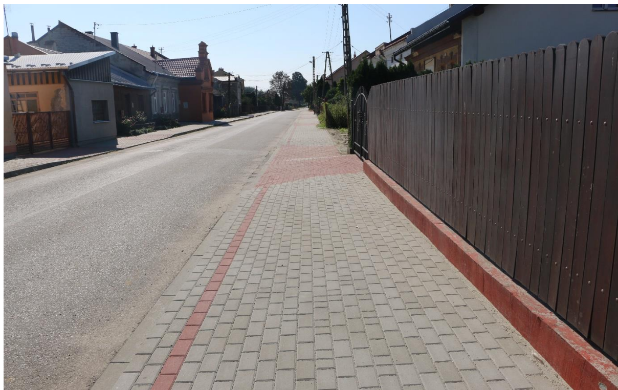
Realizacja inwestycji drogowej obejmuje również budowę nowych chodników.

powyżej 8 mln złotych. To także droga Kidałowice - Rokietnica za 4,5 mln złotych. W samym Jarosławiu na inwestycje w drogi powiatowe trafiło w 2018 r. około 6 mln złotych.