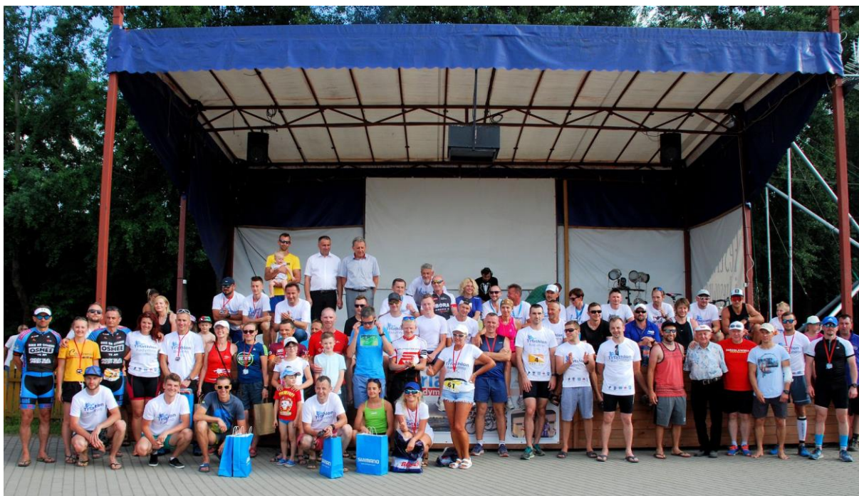
Triathlon Radymno 2018