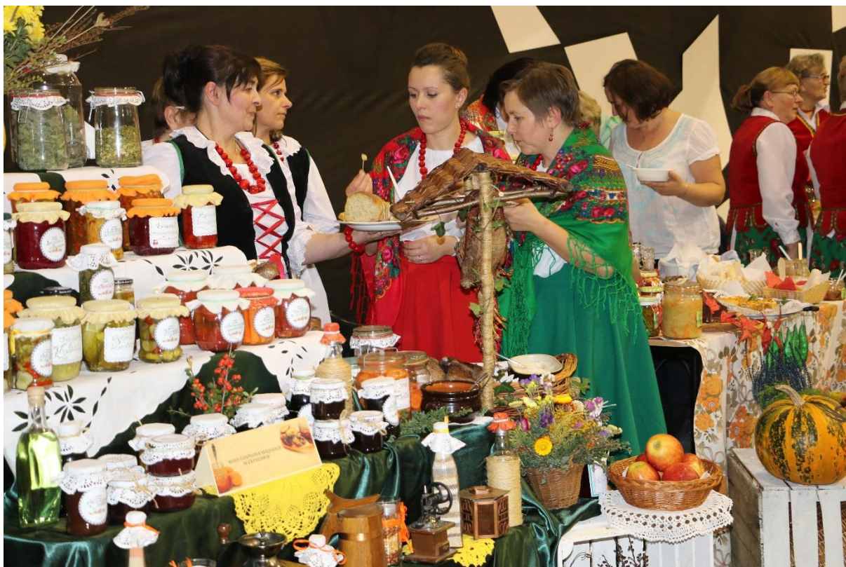
„Z babcinej spiżarni” – cykliczne wydarzenie promujące tradycyjną kuchnię regionalną.