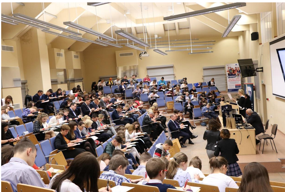
XI Jarosławskie Potyczki Ortograficzne