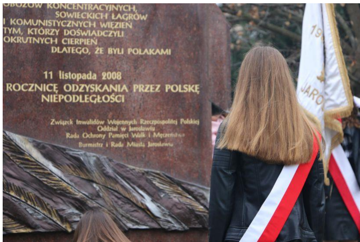
Jarosławskie dla Niepodległej – cykl uroczystości organizowanych przez Powiat Jarosławski z okazji 100-lecia odzyskania niepodległości.

Oprócz tematów zasygnalizowanych w powyższym wstępie, w tabelkach poniżej znajdują Państwo również informacje dotyczące działań zrealizowanych w ramach: gospodarki nieruchomości, administracji architektoniczno-budowlanej, gospodarki wodnej, ochrony środowiska i przyrody, rolnictwa, leśnictwa i rybactwa śródlądowego, ochrony praw konsumenta oraz współpracy z organizacjami pozarządowymi.