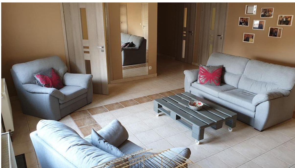
Wnętrze mieszkania chronionego.

Zadania związane ze wspieraniem osób z niepełnosprawnościami realizował także Powiatowy Urząd Pracy w Jarosławiu m.in. w postaci refundacji kosztów wyposażania stanowiska pracy, podjęcia działalności gospodarczej oraz staży.