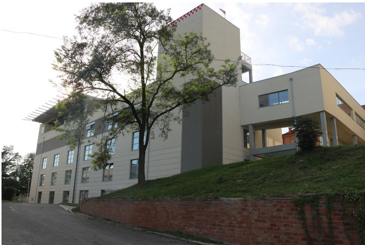
Nowy budynek neonatologii, położnictwa, ginekologii wraz z blokiem operacyjnym i lądowiskiem dla śmigłowców w COM Jarosław