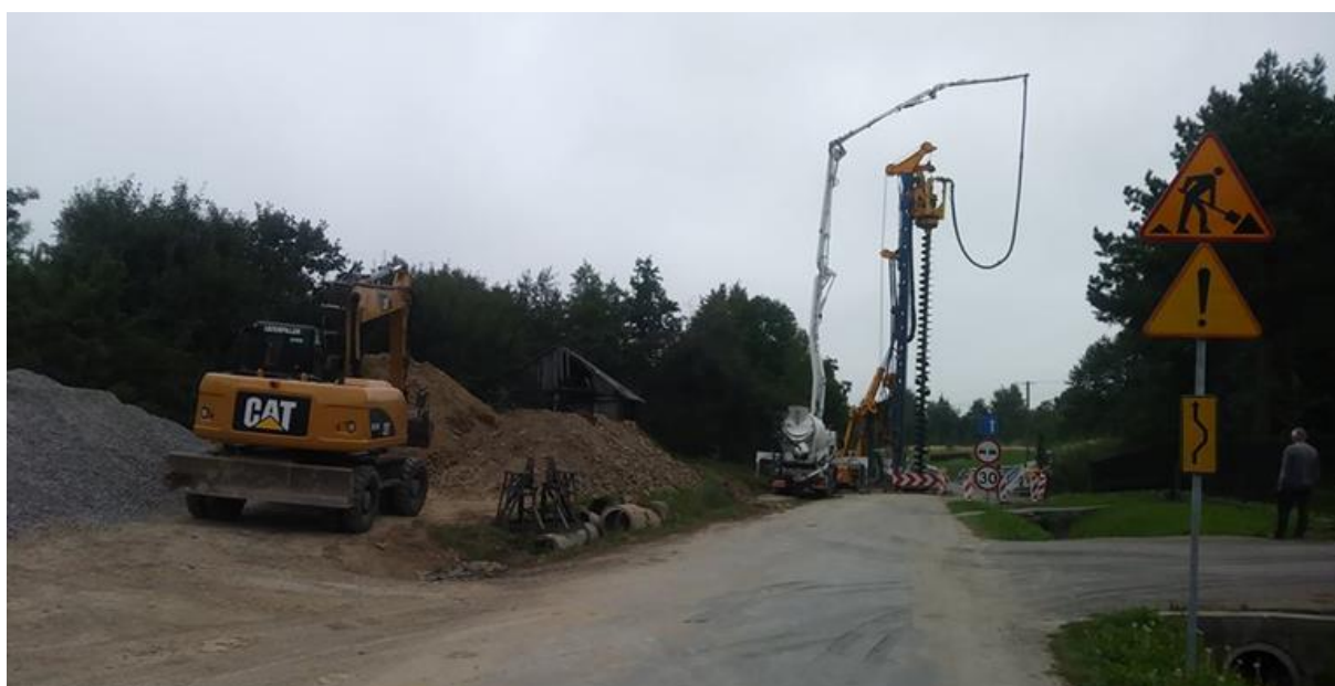
Likwidacja osuwiska w Świebodnej (gmina Pruchnik).

Całkowita wartość likwidacji osuwiska to około 11 mln złotych, z których Powiat Jarosławski zabezpiecza 20%. Pozostałe pieniądze pochodzą z budżetu państwa. Finansowanie zadania rozłożone jest na trzy lata (2018 – 2020). W roku 2018 wydano już 3,6 mln złotych, wykonując m.in. skomplikowany zabieg palowania osuwiska i założenia drenów melioracyjnych.