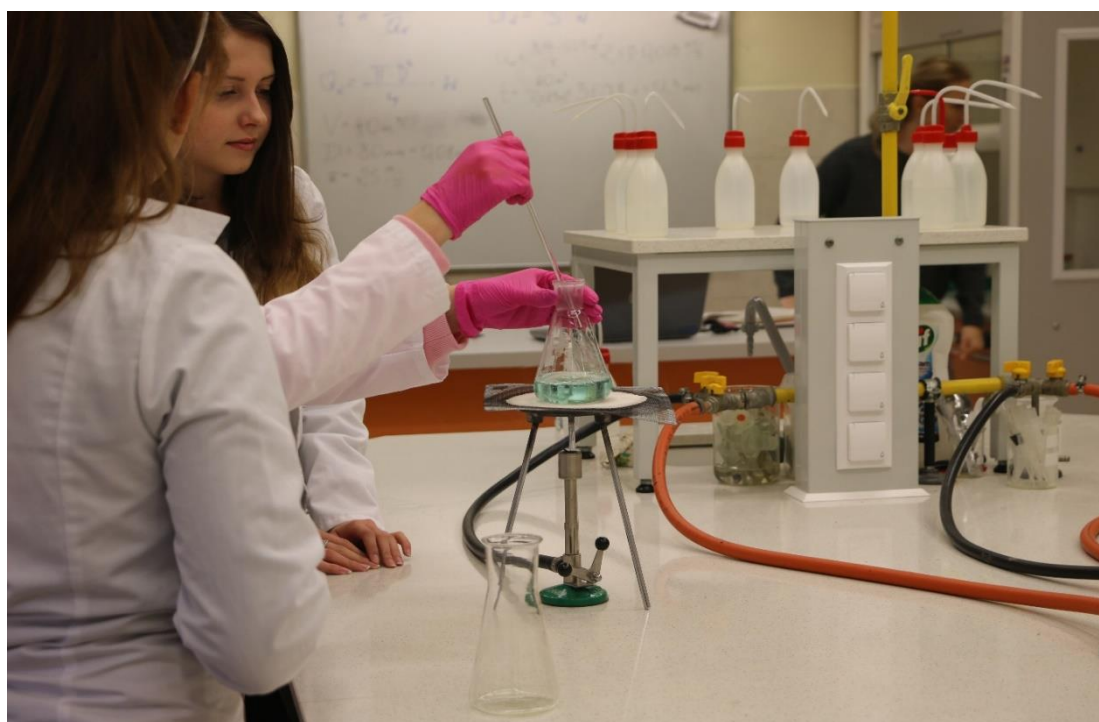
Realizacja projektu „Blżej rynku pracy” (Zespół Szkół Spożywczych, Chemicznych i Ogólnokształcących w

Zadania związane z edukacją i oświatą realizowane są w 13 szkołach i placówkach, których organem prowadzącym jest Powiat Jarosławski. Uczy się w nich i wychowuje blisko 5,5 tys. dzieci i młodzieży. Wśród najważniejszych działań związanych z edukacją w roku 2018 była realizacja projektów wzmacniających szkolnictwo zawodowe o wartości ponad 5 mln złotych. Były to projekty współfinansowane ze środków unijnych: „CKP kształci zawodowo. Wspieranie kompetencji kadr i uczniów Centrum Kształcenia Praktycznego w Jarosławiu” oraz „Blżej rynku pracy – kompleksowy program edukacji zawodowej w Powiecie Jarosławskim”.