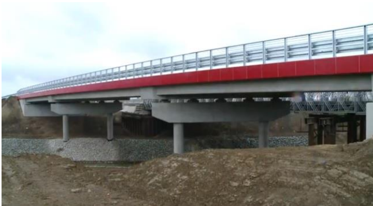
Most w Michałowce (gmina Radymno)